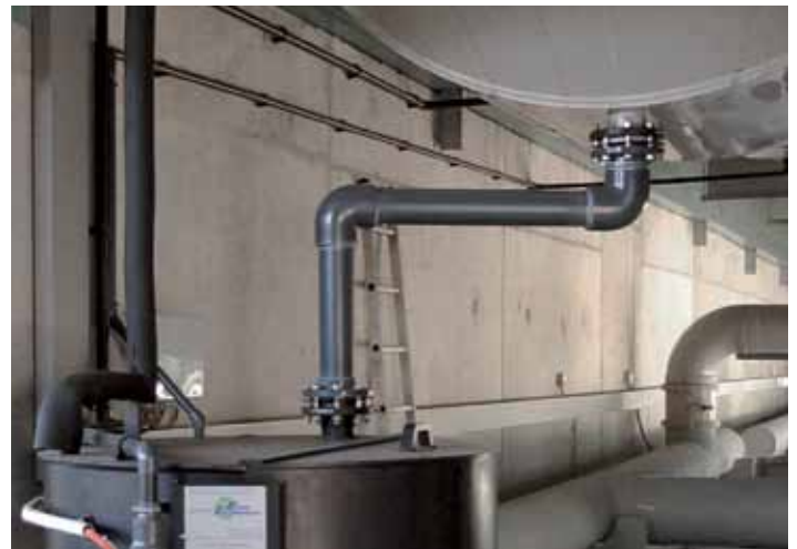
LCP avant lavage physico-chimique sur plateforme de compostage