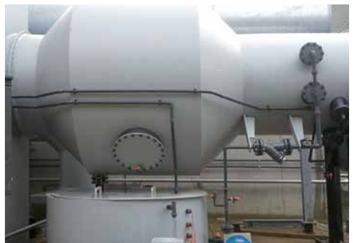
LCP en prétraitement de biofiltration