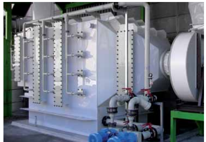
LPH (PVDF), application Métallurgie