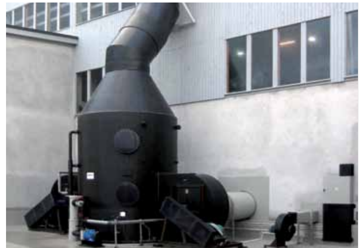
LPV, application Galvanoplastie

Cet appareil est adapté à l'industrie du traitement de surface (lignes de zingage, de chromage, de décapage acide...) ou de la chimie selon les effluents à traiter et leurs concentrations.