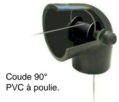
Coude 90° PVC à poulie.